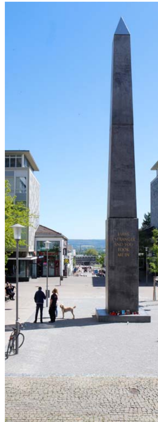
Parteilpolitische Querelen auch schon bei der Standortfindung des Obelisken.