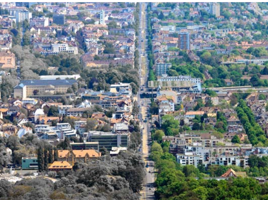
Wie soll Kassel in der Zukunft aussehen?

Wie sieht das Stadtbild 2035 aus? Es gibt neue Parks und öffentliche Grünflächen, Sport- und Spielplätze. Um Hitzesommern zu begegnen gibt es stehende Gewässer, Brunnen und Wasserspiele. Viele Initiativen, Vereine und durch die Stadt geförderte Gemeinschaftsgärten sorgen dafür, dass alle Menschen Bäume und Gartenflächen vor ihrer eigenen Haustür anlegen und gestalten können. Gleichzeitig entstehen neue Begegnungsstätten. Der öffentliche Raum gehört wieder den Menschen. Im Jahr 2035 sind aber auch große Teile der Gebäudefassaden und Dächer begrünt. Nicht nur trägt dies zur weiteren Abkühlung der Stadt bei, auch Wasser versickert langsamer und Überschwemmungen werden unwahrscheinlicher. Zuletzt wird durch die dämmende Wirkung der Pflanzen auch Energie eingespart. Neben der